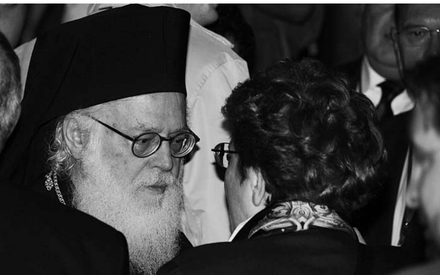
Der Ökumenische Patriarch von Konstantinopel Bartholomaios I. im Gespräch. In der Morgenandacht des ersten Thementages „Das Licht Christi und die Kirche“ hatte er die Meditation gehalten

Die Stärke der ökumenischen Bewegung ist und bleibt die persönliche Begegnung. So hat es sich beispielsweise als gute Gelegenheit für manches Gespräch erwiesen, dass (fast) alle Delegierten aus Deutschland ab München gemeinsam gereist sind. Manche Jugenddelegierte konnten Begegnungen erleben, die sie prägen werden. Die ökumenische Bewegung ist einst aus der Jugendbewegung entstanden. So ist für mich eine Konsequenz, ökumenische Jugendbegegnung besonders zu fördern. Wenn Kasper wie Huber andeuteten, es könne sein, dass die Konvergenztheologie am Ende sei, wenn nach Jahrzehnten des Gespräches so wenig Fortschritt zu erkennen ist, welches können denn Wege in die Zukunft sein? Bischof Huber hat unter anderem vorgeschlagen, einen Kanon der gemeinsamen Texte zu erarbeiten. Wer könnte das tun? Als Vorschläge wurde ein Ansetzen bei der gegenseitigen Anerkennung