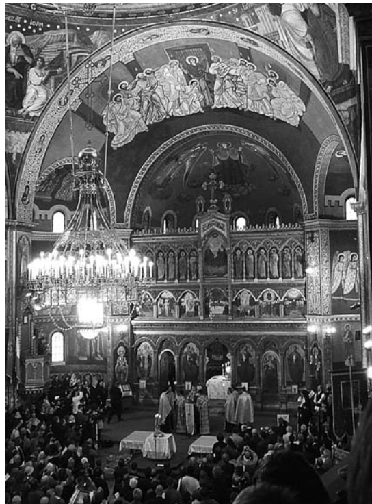
Orthodoxe Vesper am 7. September, dem Abend vor dem orthodoxen Hoch- fest der Geburt Mariens, in der Orthodoxen Kathedrale in Hermannstadt/Sibiu.