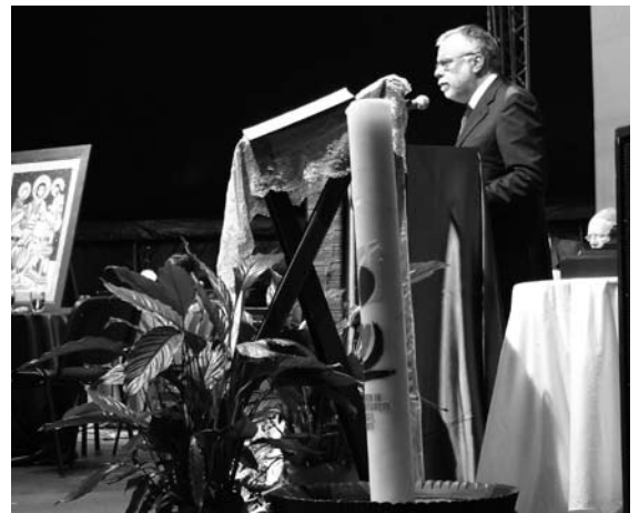
Andrea Riccardi, Gründer der Gemeinschaft Sant' Egidio, hielt zum dritten Thementag „Das Licht Christi und die Welt“ den Hauptvortrag. Vor ihm die Kerze, die schon bei der Versammlung in Graz gebrannt hatte, – mit den Logos der Versammlungen in Graz und Sibiu

Beeindruckend war, wie sich die lutherische deutschsprachige Gemeinde in die Versammlung eingebracht hat. Sie hat prägend gewirkt gerade auch mit Blick auf die ökologischen Standards der Versammlung. Das war für viele gerade in Osteuropa neu und dürfte Folgen haben. Aber auch in geistlicher Hinsicht