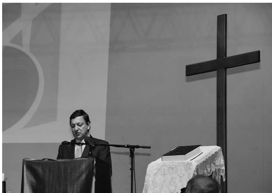
EU-Kommissionspräsident José Manuel Barroso hielt den Hauptvortrag zum zweiten Thementag „Das Licht Christi und Europa“

Frisch klang die Botschaft der Jugenddelegierten in den Ohren mit ihrer Aufforderung an die Kirchen, die Konkurrenz untereinander zu beenden. Nicht als Zukunft für die Kirchen wollen die Jüngeren angesprochen, sondern als Teil ihrer Gegenwart respektiert werden. Ihr Zeugnis gelte nicht den Machtspielen ihrer Kirchen, sondern Christus. Ob dieser Appell an Glaubwürdigkeit durch die schlussendlich per Klatschen vom Plenum empfangene offizielle Botschaft eingelöst werden kann, muss sich erst zeigen. Wird die neue „Diskussion“ über das Verständnis von Eucharistie, Amt und Kirche wirklich beginnen? Wird die Charta Oecumenica wirklich weiter entwickelt? Wird der konsultative Prozess zu ökologischer Gerechtigkeit und zu gerechter Gestaltung der Globalisierung auf den Weg gebracht? Wird der Zeitraum vom 1. September bis 4. Oktober mit Gebetstagen für die Erhaltung der Schöpfung ausgefüllt und werden nachhaltigere Lebensstile als Beitrag zur Abbremsung des Klimawandels praktisch? Am letzten Tag war zuallererst Erleichterung darüber zu verspüren, Sibiu überstanden zu