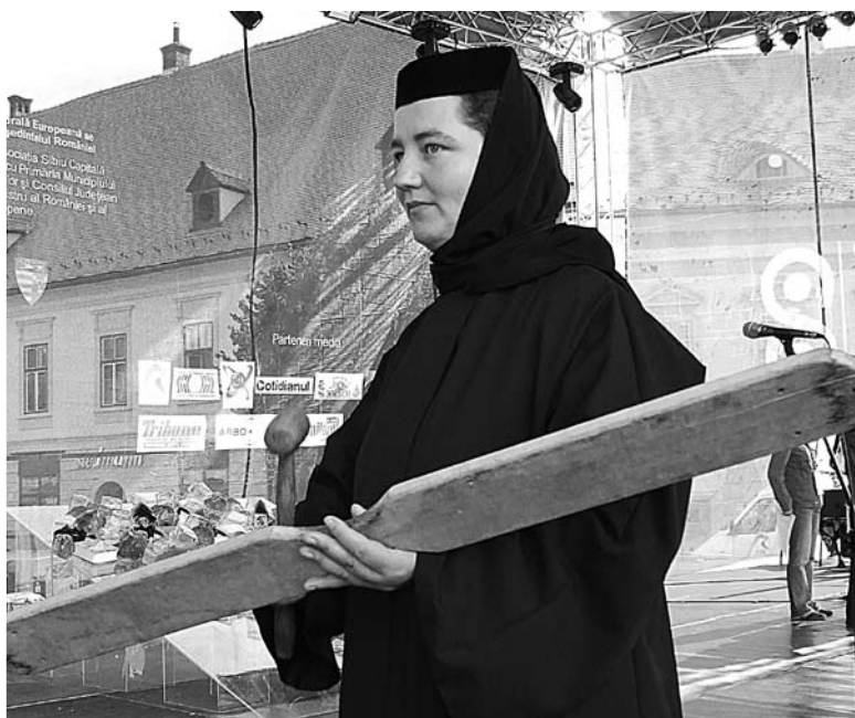
Die Andachten und Gottesdienste wurden mit der Toaca „eingeläutet“

Gut, dass wir zusammen mit dem Kirchenamt der EKD einen Gottesdienst-Workshop im Michaeliskloster in Hildesheim veranstalten konnten – eigentlich mit dem Ziel, Gottesdienst-Bausteine für die Gemeinden hier in Deutschland zu entwickeln, damit sie gleichzeitig zur Versammlung in Sibiu einen Gottesdienst würdigen feiern können, der die geistige und geistliche Verbindung zur Versammlung herstellt. Natürlich geht das am besten mit liturgischen