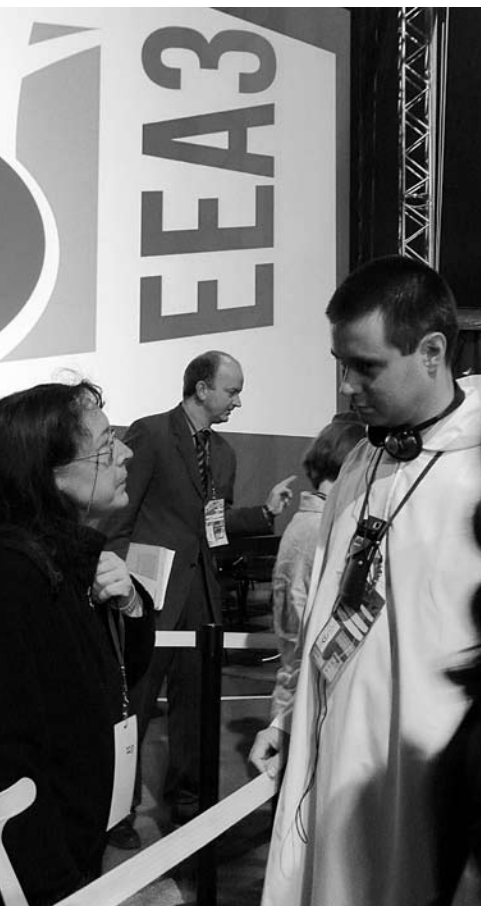
Begegnung zwischen zwei Vorträgen

Was wird konkret aus den Empfehlungen der EÖV3? Vielleicht erweist sich der in der Botschaft empfohlene Konsultationsprozess zu Gerechtigkeit und Klimaschutz als der Ort, an dem die Themen des Konziliaren Prozesses weiter bearbeitet werden.